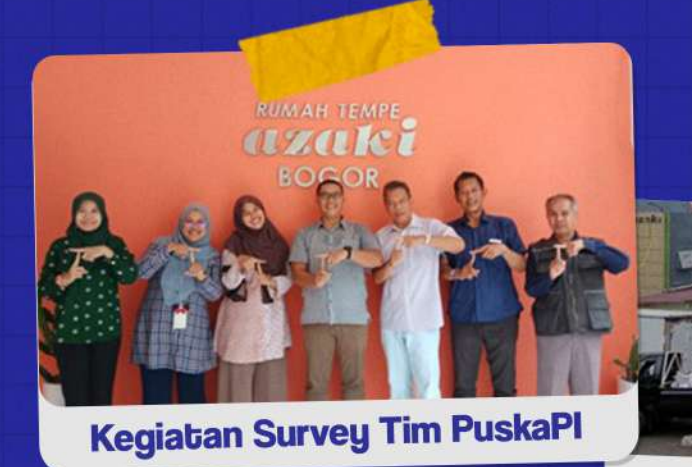
PT. Azaki Bogor